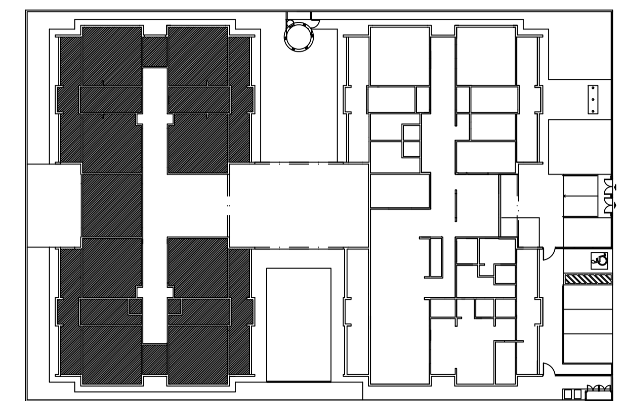
CROQUI DE REFERÊNCIA